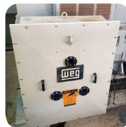
CAIXA DE LIGAÇÃO DE MOTOR